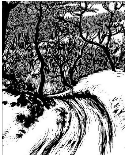
Gy. Szabó Béla alkotása

Aki elhajol, elpártol a Krisztusról szóló evangéliumtól, az Istentől hajol el, Istentől pártol el. Pál ezt nem akarja, ezért beszél és tanít harciasan. Világosan fogalmaz, aki a kijelentett evangéliumtól elpártol, az átok alatt legyen.